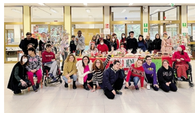
Foto di gruppo per i ragazzi

Il traguardo al quale puntavamo «era raccogliere 300 eu-