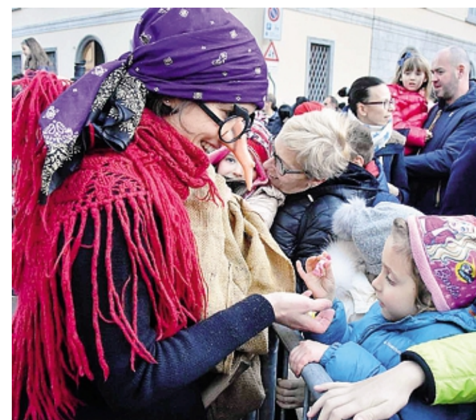
Attesa tra i più piccoli per l'arrivo domani della Befana