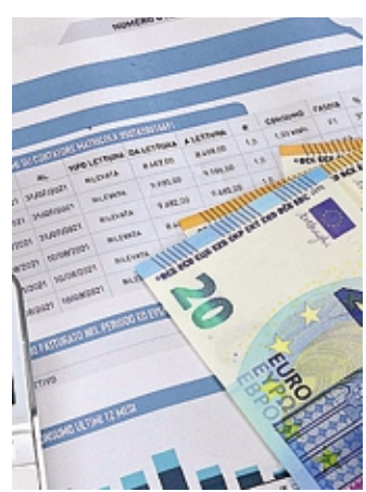
L'incubo delle bollette