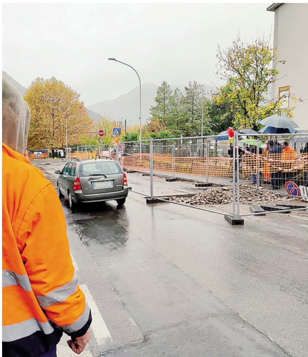
L'area cittadina a ridosso del primo cantiere per il teleriscaldamento, in via del Roccolo