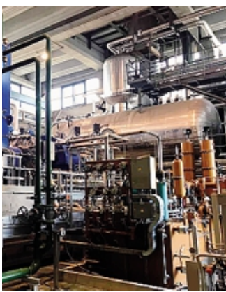
La turbina di Valmadrera

Il Pnrr finanzia con quasi 12 milioni di euro il teleriscaldamento: sono stati assegnati alla società Acinque Energy Greenway per il progetto che è in fase di attuazione a Lecco e Valmadrera, poi interesserà anche Malgrate. Brinda, dunque, chi ha sempre creduto nel teleriscaldamento, considerando il finanziamento del Pnrr come la migliore attestazione della validità dell'iniziativa e delle caratteristiche tecniche e progettuali. È una risposta alle critiche, anche recentemente espresse da orga-